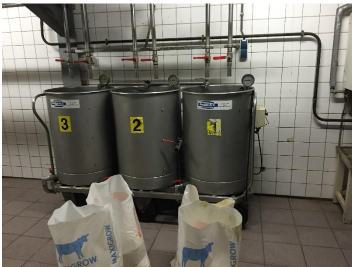
Fig. 1 De rijdende mengers

Aan de buitenkant van het bedrijf is niet te zien dat het hier om een proeflocatie gaat. Maar zodra je door de hygiëne sluis heen bent en de voerkeuken instapt blijkt wel dat dit geen traditioneel bedrijf is. Als eerste valt de ruime opstelling op; een ruim opgezette voerkeuken met daaraan vast een groot opslagmagazijn voor proefvoerders. In de voerkeuken staan bijzondere mixers, rijdende mixers waarin drie verschillende soorten voer kunnen worden bereid en uitgedoseerd (fig1)